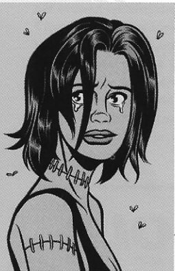
Coverillustratie voor Close Your Eyes , vrij werk (2001)