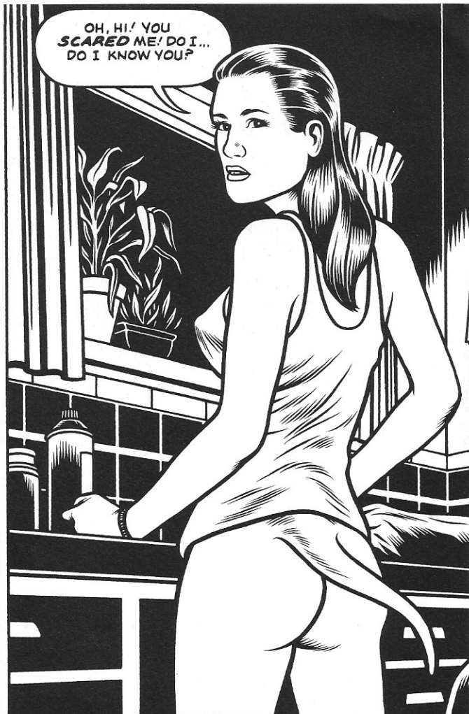
Black Hole #4: een verhaal met een staartje...

maken dat net zo goed is. Gelukkig ben ik laat genoeg begonnen en werd ik niet heel snel populair – daardoor kan ik nu aan een volwassen verhaal werken. Ik had tijd nodig. Ik moest leren een verhaal te vertellen en ik moest rijpen als schrijver, voordat ik een complex verhaal als dit kon maken. In mijn eerste verhalen streefde ik naar een heel traditionele